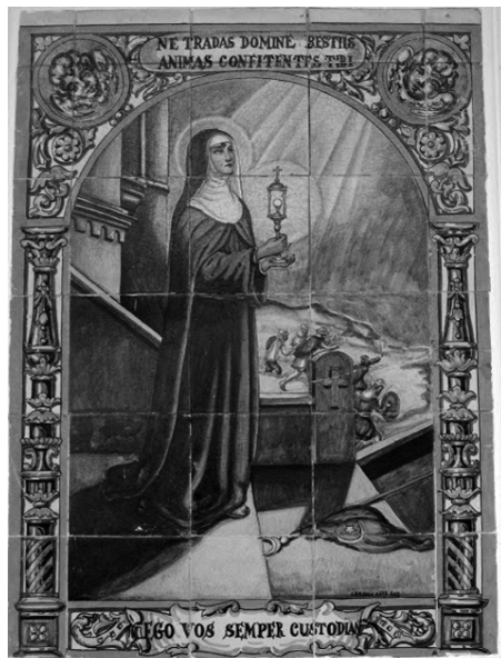
Azulejo de Santa Clara con la petición y la respuesta del Señor. situado en c/ Utrera 1, (Morón de la Frontera)

«Una vez entraron los sarracenos en el claustro del monasterio, y madonna Clara se hizo conducir hasta la puerta del refectorio y mandó que trajesen ante ella un cofrecito donde se guardaba el santísimo Sacramento del Cuerpo de nuestro Señor Jesucristo. Y, postrándose en tierra en oración, rogó con lágrimas diciendo, entre otras, estas palabras: “Señor, guarda Tú a estas siervas tuyas, pues yo no las puedo guardar”. Entonces la testigo oyó una voz de maravillosa suavidad, que decía: “¡Yo te defenderé siempre!”, ( Ego vos semper custodiam ). Entonces la dicha madonna rogó también por la ciudad, diciendo: “Señor, plázcate defender también a esta ciudad”. Y aquella