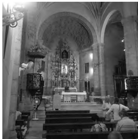
Iglesia de Santiago. Alcalá de Guadaíra (En tránsito de la 2ª Etapa)