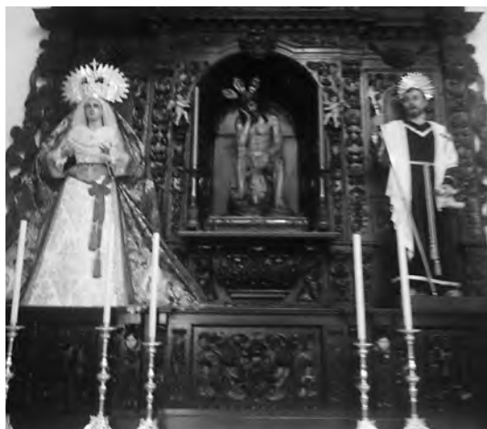
Parroquia de la Asunción. Sede de la Hdad. de la Humildad. Mairena del Alcor (Final de la 1ª Etapa)