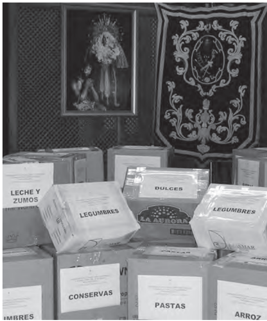
Años 2005 y 2006 Banco de alimentos de Sevilla

En estos cuatro años, la Cesta Solidaria Señor de la Humildad se ha donado al Banco de Alimentos de Sevilla en los años 2005-06 y al pueblo africano de Togo en los años 2007-08.