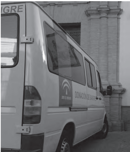
Donaciones de sangre Señor de la Humildad)

Finalizada la Semana Santa, en el mes de abril tuvo lugar la "Donación de sangre Señor de la Humildad", que este año sumaba su octava edición. Debemos estar muy satisfechos por seguir poniendo en marcha esta actividad, que cada año va aumentando en las donaciones. Este año se han superado las 167 en los tres días que duró.